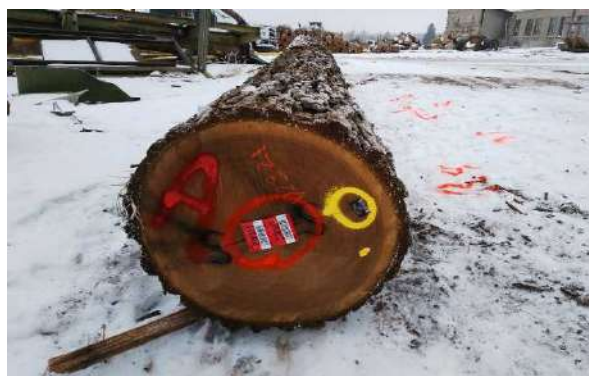
2018年12月11日買い付け ナット原木